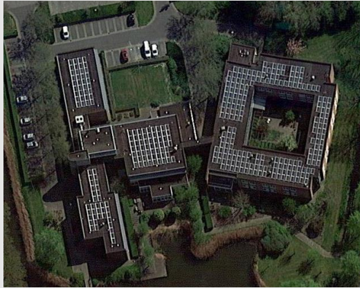
Locatie Geestercogge van GGZ NHN. Veel van de voor de warmtepomp benodigde elektriciteit wordt door de zonnepanelen opgewekt.